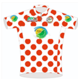
Maillot Montagne Conseil Régional 21. CHANE FOC Julien Team Madras Cycling Belle eau