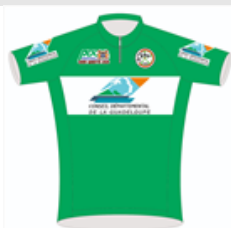
Maillot Combiné Conseil Départemental 44. LUTIN Larry Espoir du Sud