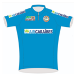
Maillot Points Air Caraïbes 7. CHANUT Lucas Equipes mixtes CCD/CCM