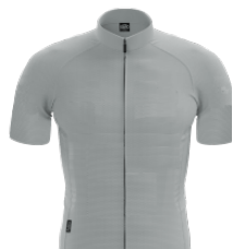
Vainqueur de l'étape 84. PERKINS Bradley Uni Sport Lamentinois